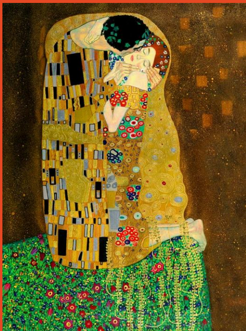
Η σεξουαλικότητα: Γκούσταφ Κλιμτ (1862-1918) The Kiss, 1907-08